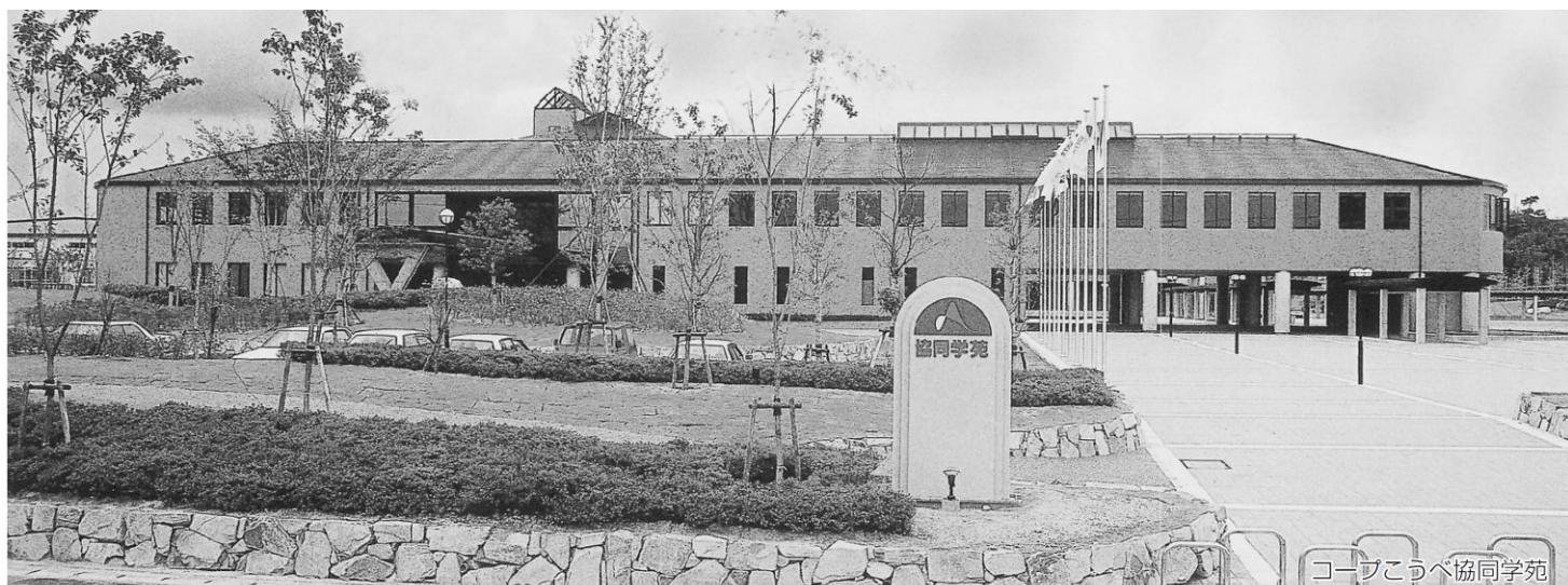
コープこうべ協同学苑