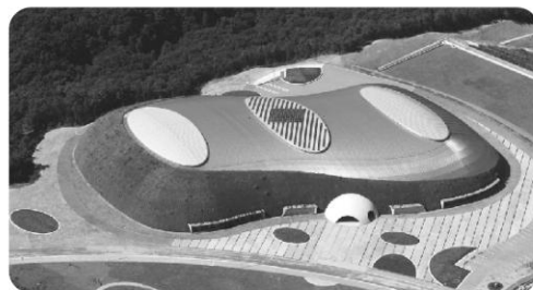
決勝大会会場：ブルボン ビーンズドーム