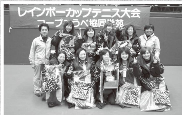
昨年度の団体優勝チーム〔兵庫県〕の皆さん