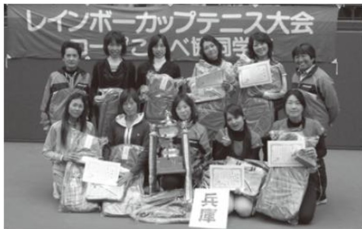
昨年度の団体優勝チーム〔兵庫県〕の皆さん