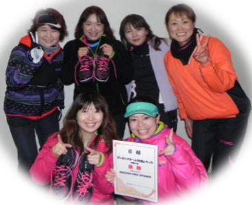
2013年度 一般の部 優勝チーム「Victory. 1」(愛媛県)

参加資格 参加資格については別紙参照 服装 テニスウエア着用 長ズボン着用可 (JTAルールに基づく) 参加賞 定価¥3,000~3,500程度のオリジナルダンロップ商品 抽選会賞品 協賛各社、ダンロップからの豪華賞品(空くじなし) 入賞賞品 1. 2. 3位トーナメント ベスト4 特別賞 シニアの部合計最高年齢チーム