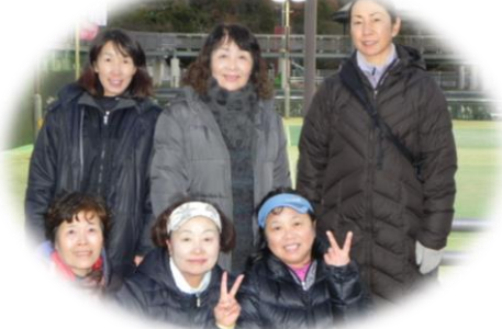
2013年度 シニアの部 優勝チーム「しばてん」(高知県)