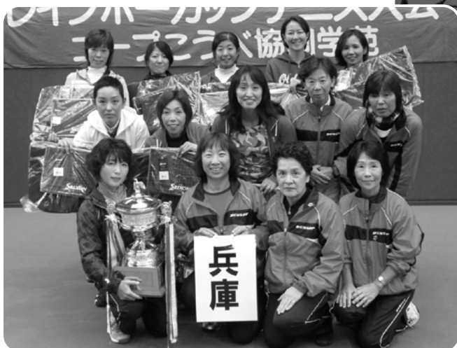
昨年度の団体優勝チーム〔兵庫県〕の皆さん