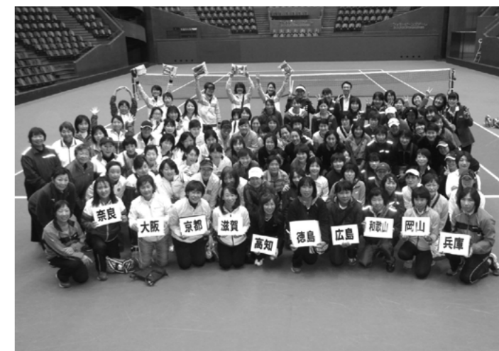
昨年度参加者の皆さん