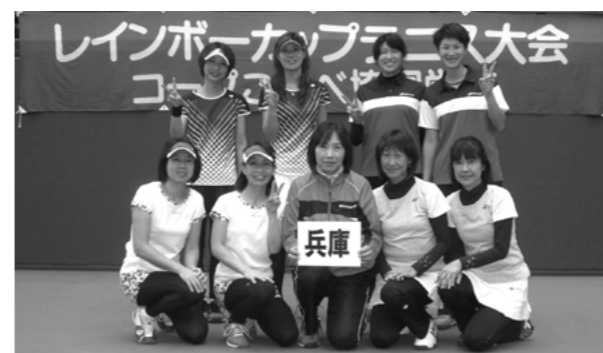
昨年度の団体優勝チーム〔兵庫県〕の皆さん