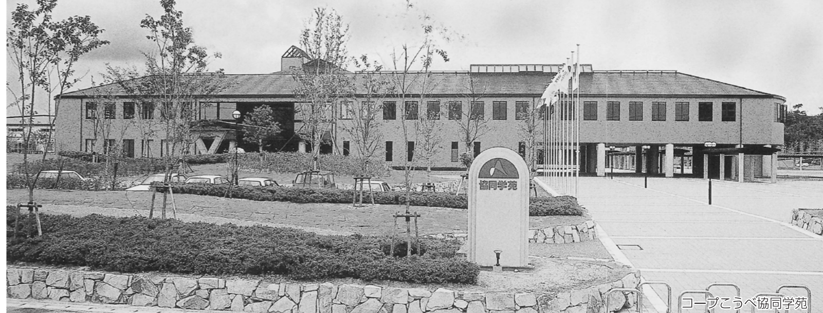
コープこうべ協同学苑